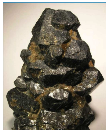
Figura 1. Imagen de uraninita [5]

nucleares, lo cual dio lugar a la fabricación de las bombas nucleares de Hiroshima y Nagasaki en 1945. Se basaban en uranio enriquecido y en plutonio (derivado de uranio). También se suele usar el uranio como estabilizador en aviones, como blindaje frente a radiaciones penetrantes, y en carros de combate como uranio empobrecido, el cual tiene una proporción de 235 U inferior a la del uranio natural.