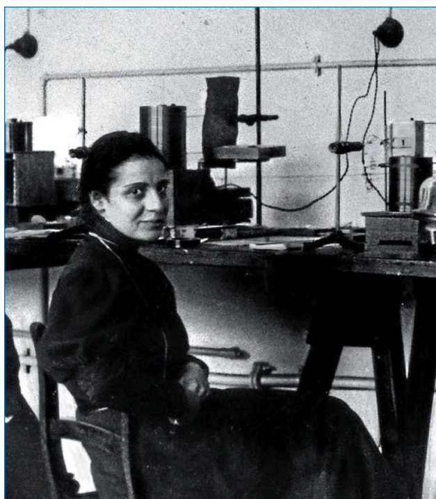
Figura 1. Lise Meitner en el Instituto de Química Kaiser Wilhelm de Berlín (1919).

Meitner formó parte del equipo que descubrió la fisión nuclear, pero ni ella ni Otto Frisch compartieron el Premio Nobel de Química de 1944 que se otorgó exclusivamente a Otto Hahn. Este hecho se considera uno de los más evidentes ejemplos de injusticia realizados por el comité del Nobel; en la década de 1990 se abrieron los registros del comité que decidió el premio, y a la luz de la información que proporcionaron, se ha intentado reparar: Meitner ha recibido muchos honores póstumos, entre ellos el ya citado nombramiento del elemento químico 109 como meitnerio.