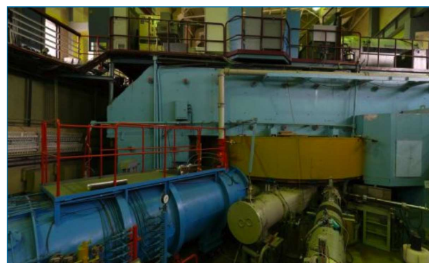
Figura 2. Ciclotrón U400 del JINR donde se aceleraron iones de 48 Ca, isótopo poco abundante del Ca, con energías de 251 MeV. El blanco estaba formado por óxidos de 249 Cf depositados en láminas de Ti de 1,5 μm de espesor [4]

se siguen observando en la distribución de los neutrones. Por lo tanto, los números mágicos de N y Z asociadas a los núcleos más estables parecen desaparecer para estos elementos superpesados, siendo probablemente el 208 Pb el último núcleo doblemente mágico [3] (N y Z par).