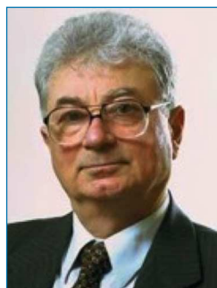
Figura 1. Yuri Ts. Oganessian (1933), director científico del Laboratorio Flerov de Reacciones Nucleares, del JINR en Dubná (Rusia), codescubridor de los últimos 6 elementos superpesados (Z ≥ 113)

se siguen observando en la distribución de los neutrones. Por lo tanto, los números mágicos de N y Z asociadas a los núcleos más estables parecen desaparecer para estos elementos superpesados, siendo probablemente el 208 Pb el último núcleo doblemente mágico [3] (N y Z par).