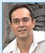
J. A. Bustelo 1