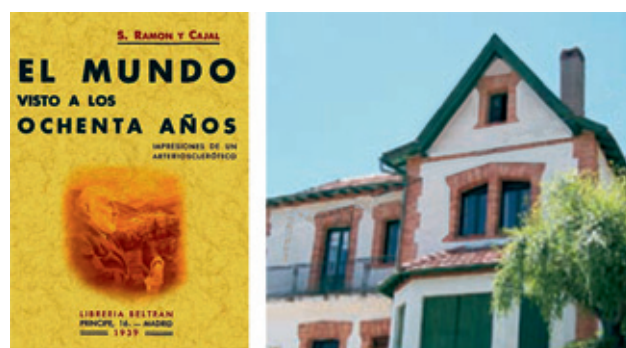
Figura 1. “Recuerdos” de Santiago Ramón y Cajal.

Para un químico este problema puede plantearse así: dado que es conocido que el único enlace que puede repetirse