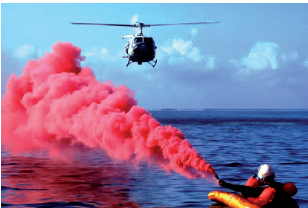
Figura 4. Bomba de humo usada en salvamento marítimo.

Otros ejemplos adicionales se pueden encontrar en los portales web sobre química y vida cotidiana que desarrollan desde hace tiempo los autores de este trabajo. 12,13 Como curiosidad, uno de ellos recogió en un vídeo cómo se realizó una simulación de fumata blanca en una exposición divulga-