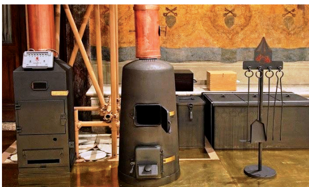
Figura 2. Estufa para quemar las papeletas del cónclave (derecha) y aparato auxiliar para la quema de los fumígenos (generadores de humo) específicos.

electrónico, en una estufa auxiliar, que activa un cartucho que contiene cinco cargas y que, a su vez, se van activando una tras otra durante un tiempo de unos siete minutos. Esos cartuchos, según las fuentes mencionadas, están confeccionados con clorato de potasio, lactosa y colofonia (un ámbar natural que se obtiene de ciertas coníferas), para originar la fumata blanca, y con perclorato de potasio, antraceno y azufre para la fumata negra.