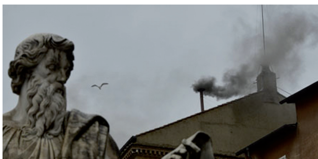
Figura 1. Aspecto de la fumata blanca producida en el Vaticano el 13 de marzo de 2013 (arriba) y, desde otro ángulo, de la fumata negra del día anterior.